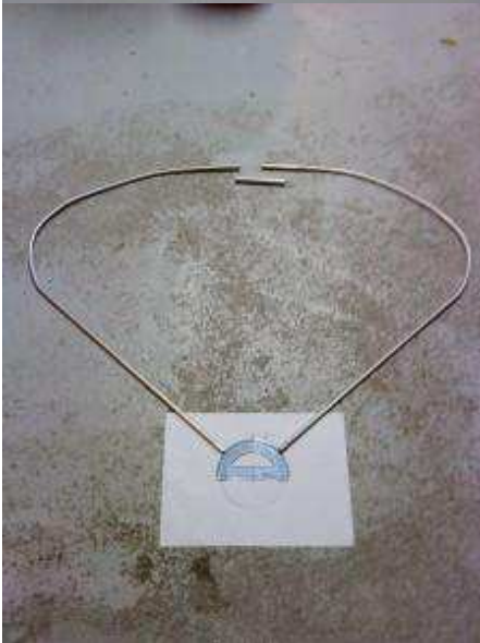
( http://ara35.fr/wp-content/uploads/2015/05/DSC00031.jpg )